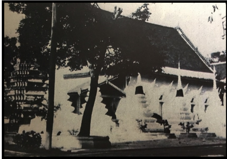
พระอุโบสถหลังเก่า วัดกลางวรวิหาร สถานที่ถือน้ำพิพัฒน์สัตยา