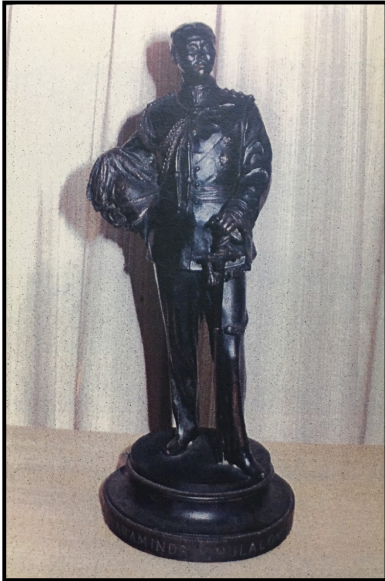
พระบรมรูปรัชกาลที่ ๕ ประจำเมืองสมุทรปราการ ประดิษฐาน ณ กุฏิคณะ ๖ วัดกลางวรวิหาร อำเภอเมือง สมุทรปราการ

จึงปรากฏ มีนักสะสมของเก่า (คิดชั่ว) หมายถึงอยู่ตลอด พระบรมรูปองค์รัชกาลที่ ๕ จึงถูกเก็บรักษาไว้ อย่างมิดชิด และมีการก่อเหล็กยึดไว้อย่างแข็งแรง เพื่อป้องกันโจรขโมยมาขโมยออกไป หากไม่ใช่ผู้มีบารมี หรือผู้ที่ได้รับความไว้วางใจจากทางวัด ก็ไม่มีสิทธิ์จะเข้าไปถวายความเคารพ ผู้เขียนเองก็ไม่กล้าที่จะขอ อนุญาตเข้าไปชมพระบรมรูป เพียงได้รับความอนุเคราะห์ภาพถ่าย มาให้ได้ชมกัน ก็ถือว่าเป็นบุญแล้วครับ